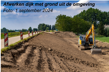
Afwerken dijk met grond uit de omgeving Foto: 1 september 2024

In dezelfde periode hebben we ook de binnenkant van de dijk ingezaaid met een speciaal dijkmenngsel (gras) voor een groene, stevige bekleding.