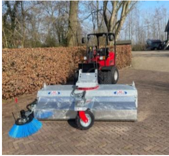
Bezem met een shovel. Deze is wendbaar en het aankoppelen gaat snel.