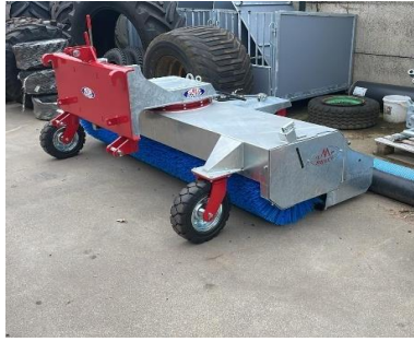
Veegbezem voor achter de trekker, voor grote oppervlakten.