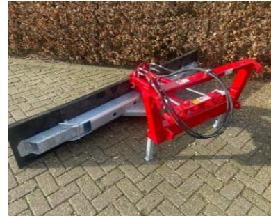
Rubberschuif: te gebruiken om erf en paden te schuiven, waarna het opgeruimd kan worden. Minder stof als het droog is, minder spetters als het nat is.

Hierbij verklaart ondergetekende, dat er een adviesgesprek op _____ (datum) heeft plaatsgevonden met de watermakelaar uit uw collectief.