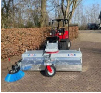
Bezem met een shovel. Deze is wendbaar en het aankoppelen gaat snel.