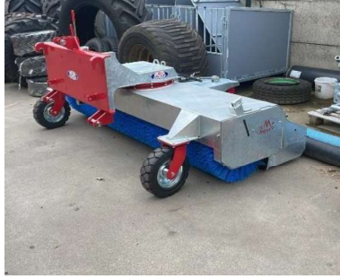
Veegbezem voor achter de trekker, voor grote oppervlakten.