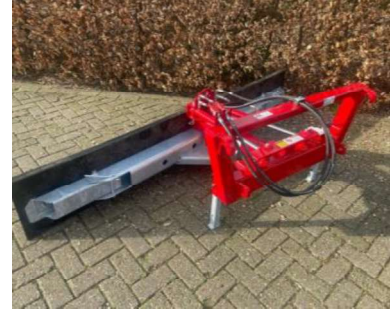
Rubberschuif: te gebruiken om erf en paden te schuiven, waarna het opgeruimd kan worden. Minder stof als het droog is, minder spetters als het nat is.

Hierbij verklaart ondergetekende, dat er een adviesgesprek op _____ (datum) heeft plaatsgevonden met de watermakelaar uit uw collectief.