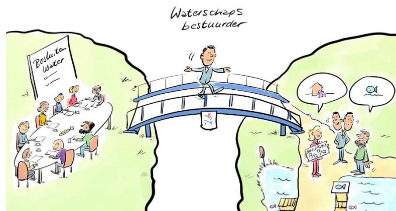
Figuur 3. De brug tussen de representatieve en de participatieve democratie

Ook kan het algemeen bestuur tijdens interactiemomenten met de omgeving (bijvoorbeeld tijdens inloopavonden en ontwerpateliers) de rol van toehoorder aannemen en zo een deel van de controlerende rol invullen. Nadrukkelijke betrokkenheid van het algemeen bestuur bij een proces geeft aan dat de het de inbreng serieus neemt. Dit kan het vertrouwen in het waterschap vergroten.