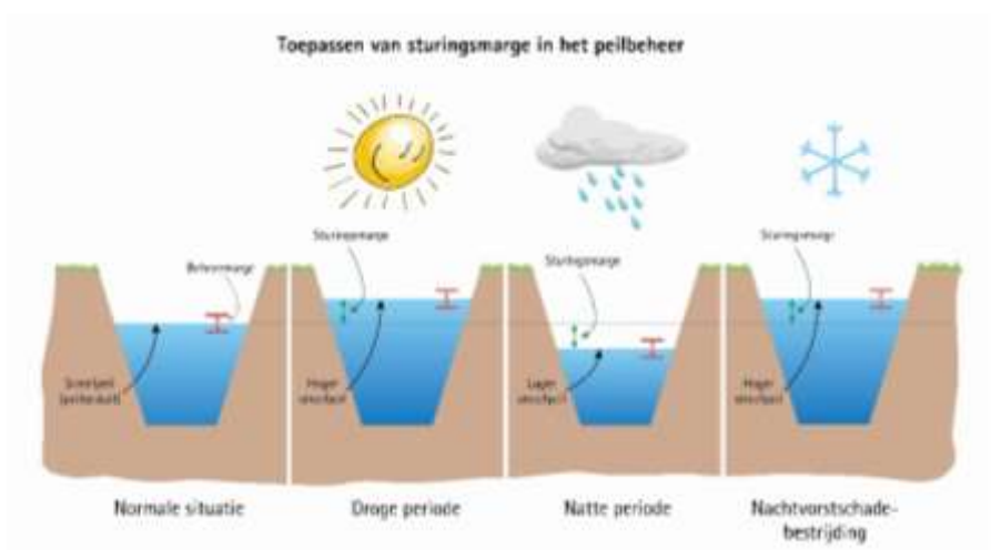
Figuur 1 visualisatie van de beheer- en sturingsmarge

Naast de beheermarge is ook de sturingsmarge aangepast. In de peilbesluiten staat opgenomen dat alleen het college van Dijkgraaf en Hoogheemraden het besluit kan nemen om maximaal 10cm anders te sturen. Met het vaststellen van de Beleidsnota Peilbeheer 2019 hoeft het college van Dijkgraaf en Hoogheemraden niet langer te besluiten dat de sturingsmarge wordt ingezet, maar mag het gebiedsteam dit bepalen. Daarvoor moet artikel 4 van het peilbesluit worden aangepast, om deze wijziging expliciet te maken.