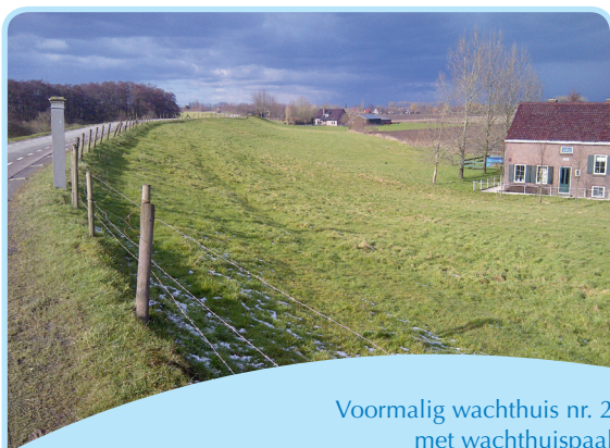
Voormalig wachthuis nr. 2 met wachthuispaal

Als het waterpeil in de Lek steeg tot 'Clockeslag'-peil werd de kerkklok van Jaarsveld geluid. Dit alarmsignaal werd overgenomen door andere kerkklokken in de Lopikerwaard. Zo werd het dijkleger opgeroepen, dat bestond uit totaal 7500 weerbare mannen tussen de 18 en 65 jaar. De manschappen moesten zich verzamelen in tien wachthuizen langs de Lekdijk. Deze zijn nog steeds te herkennen aan een hardstenen, genummerde paal bovenaan de dijk.