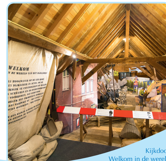
Kijkdoos Welkom in de wereld van het dijkleger

Tijdens een rondleiding start u met een bezoek aan de exposities op de zolders van de Zwarte Schuur en het stenen wachthuis. 'Welkom in de wereld van het Dijkleger' is een levensgrote 'kijkdoos' met beelden van het dijkleger vroeger en nu; de expositie 'Dijkhuis en waterbeheer' geeft inzicht in de geschiedenis van het Dijkhuis en natuur en cultuurhistorie op en rond de Lekdijk. Bij de rondleiding bezoekt u deze exposities, de omgeving van het dijkhuis en de grote vergaderzaal en de dijkgraafkamer in het Dijkhuis. U krijgt een beeld van het leven en werk van dijklegersoldaten en adellijke dijkgraven en hoogheemraden uit vroeger tijden.