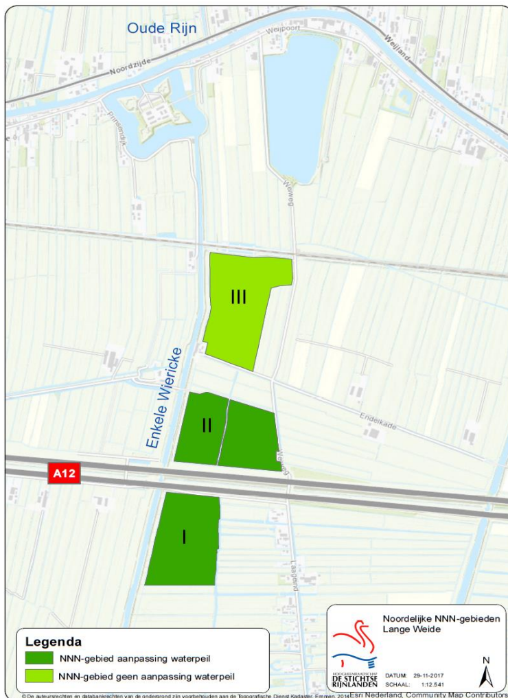
Figuur 1: Noordelijke NNN-gebieden Lange Weide